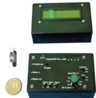
コントローラ・ディスプレイ