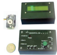
別売専用コントローラと別売ディスプレイ